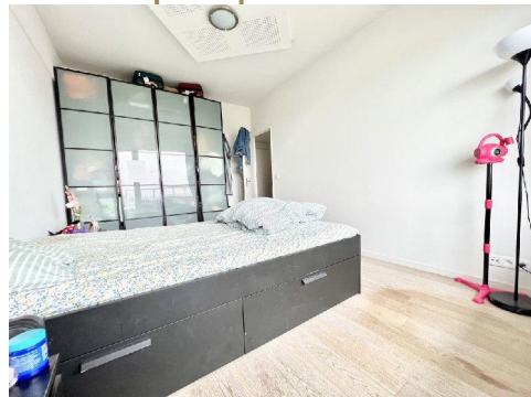
Chambre principale :