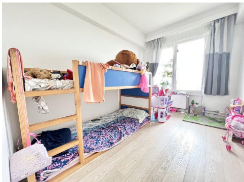
2ème chambre :