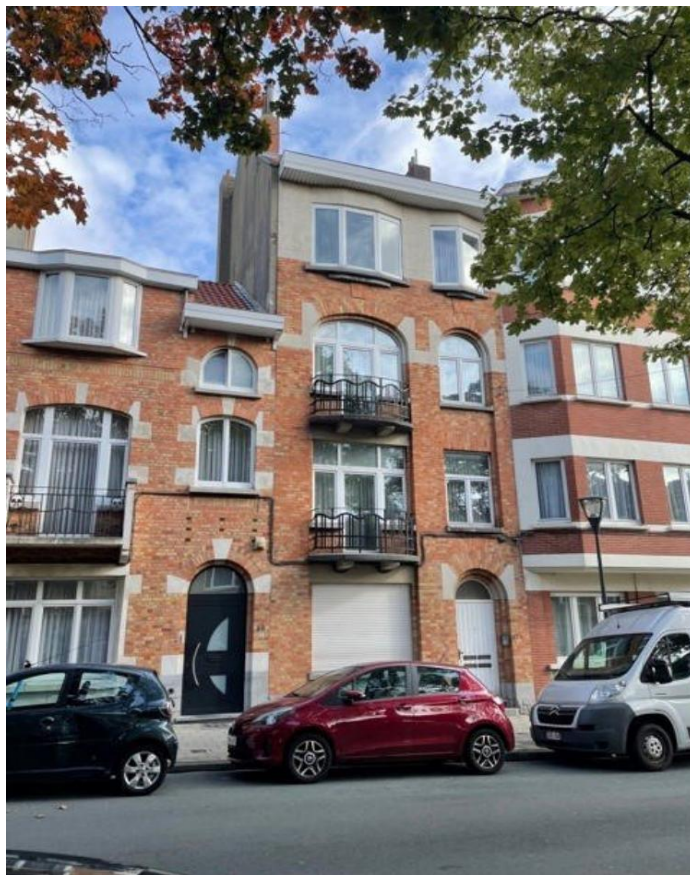
Koekelberg (réf 2260 B) :

Bel Immeuble de rapport à proximité de la Basilique Nationale du sacré-Coeur comprenant 4 logements, reconnu par l'urbanisme. Libre d'occupation.