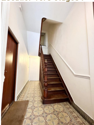
Escalier vers étages :