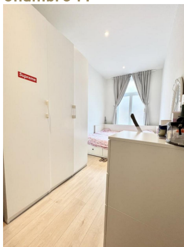
Chambre 1 :