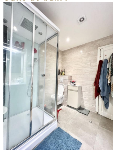
Salle de bain :