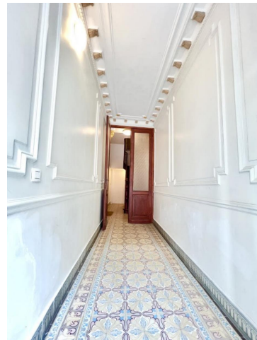
Hall d'entrée :