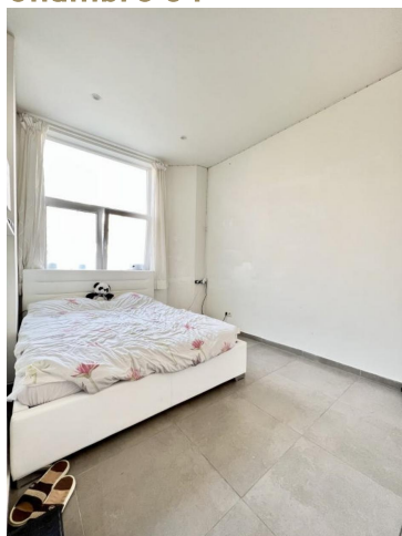
Chambre 3 :