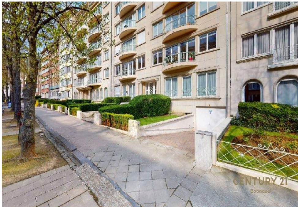
Ixelles (réf 2060 B):

Avenue des Saisons, 42 à 1050 Ixelles 02/660.21.21